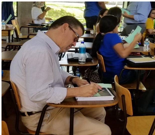
Docente aportando al proceso