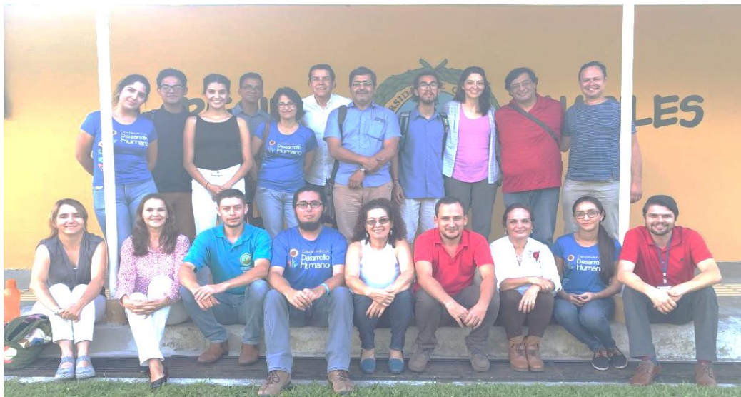
Jornada de análisis de la información en Guápiles