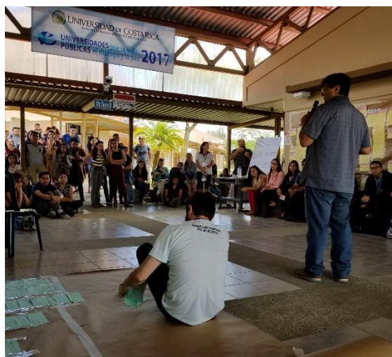
Plenaria final en Paraíso