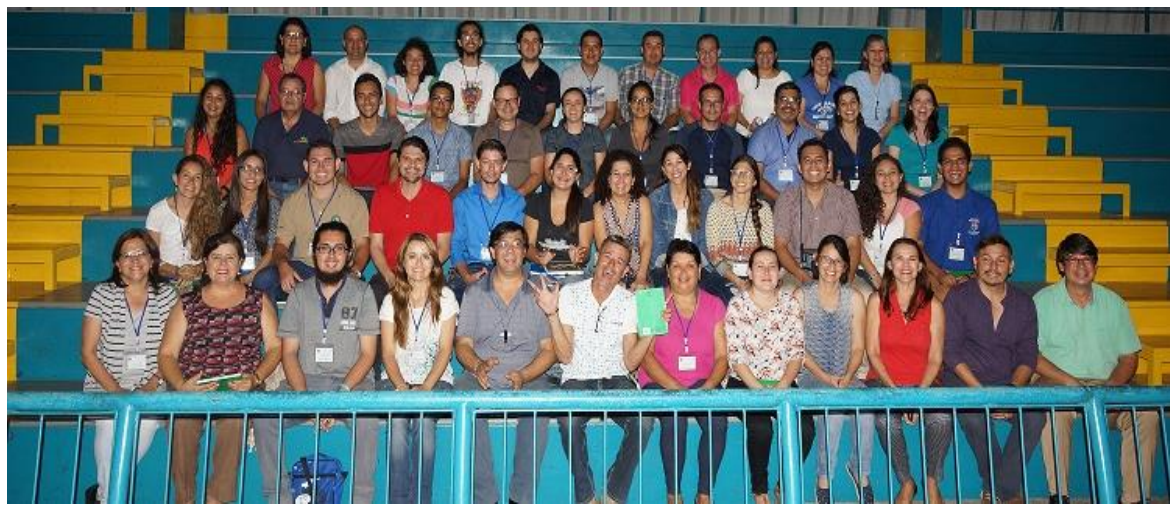
Equipo de Gestión del Plan del PESA, último día de formación