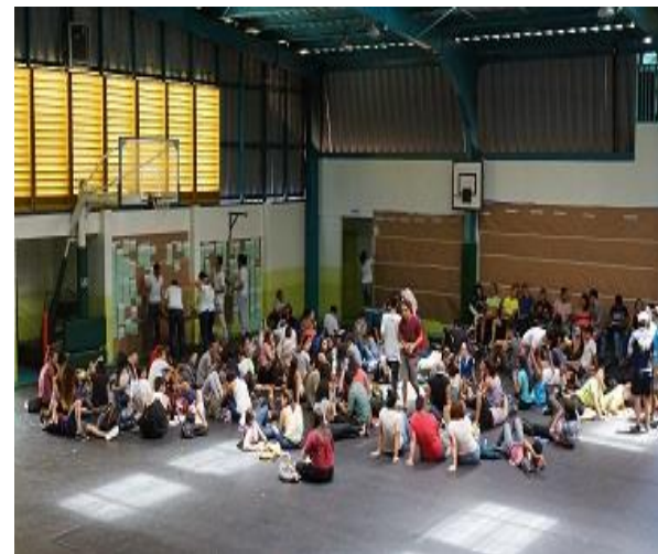
Claustro estudiantes Turrialba