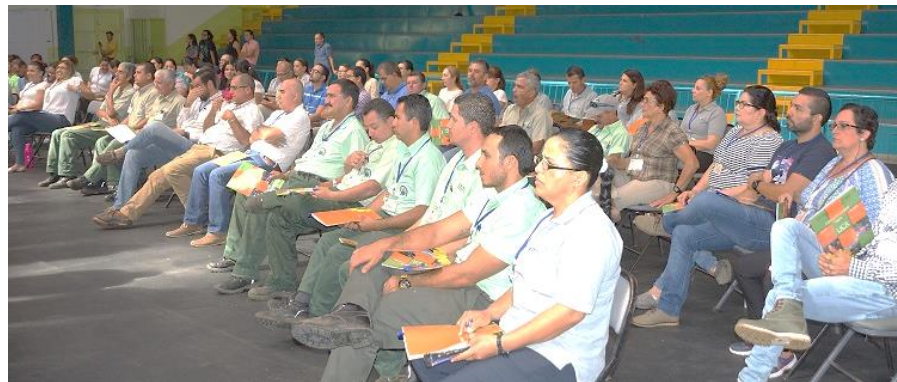
Claustro con funcionarios de la Sede y recintos Paraíso y Guápiles n= 140